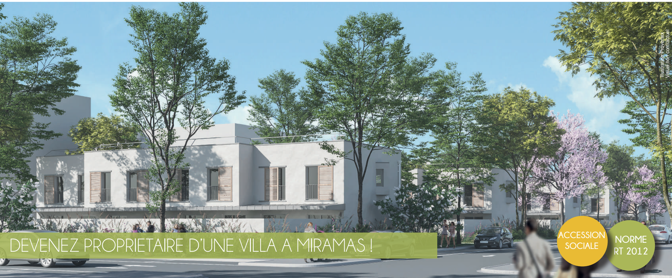
Illustration - Projections Visuel non contractuel

DEVENEZ PROPRIETAIRE D'UNE VILLA A MIRAMAS !